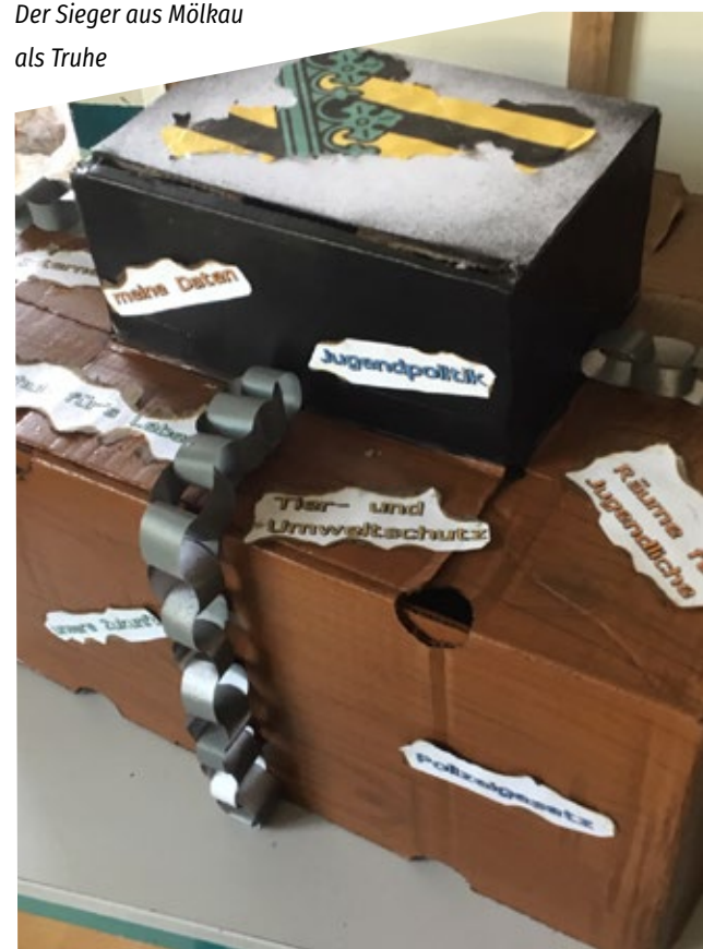
Der Sieger aus Mölkau als Truhe

Auch die weiteren Einsendungen haben viel Kreativität und Mühe in die Wahlurnen gesteckt. Das zeigt uns, dass eine Wahl für Kinder und Jugendliche diese auf allen Sinnesebenen ansprechen kann. Dafür gab es als Dank noch Süßigkeiten und ein Päckchen Kaffee, für die aktive Unterstützung der Fachkräfte und Teamer*innen vor Ort.